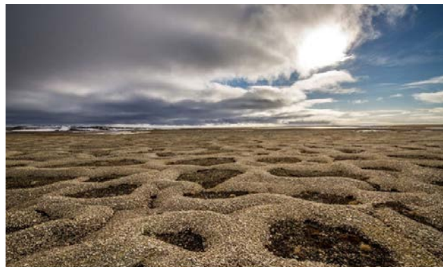
Abb.4: Wenn der Permafrostboden auftaut, werden grosse Mengen an CO 2 freigesetzt.

Im Quellenverzeichnis sieht dies so aus: